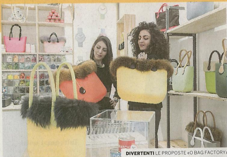
CHARA DIOMEDE DIVERTENTI LE PROPOSTE «O BAG FACTORY»